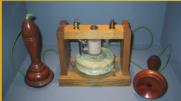
Le système Bell (1877)

Le premier téléphone a été créé par Antonio Meucci. Il l'aurait réalisé, en 1850, pour communiquer entre son bureau et la chambre de sa femme, paralysée par des crises d'arthrite. Alexander Graham Bell reprit son invention pour déposer un brevet. Le téléphone fonctionnait grâce à l'électricité.